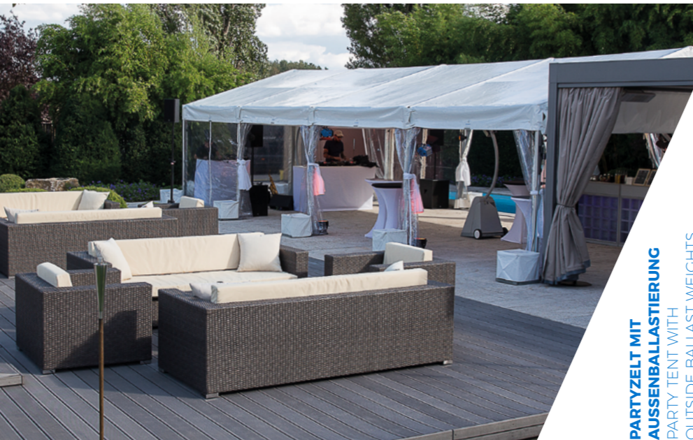
PARTYZELT MIT AUSSENBALLASTIERUNG PARTY TENT WITH OUTSIDE BALLAST WEIGHTS